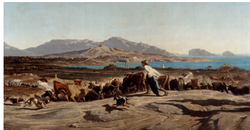
Vue de Marseille prise des Aygalades un jour de marché - Émile Loubon (Aix-en-Provence, 1809 - Marseille, 1863) - Huile sur toile - Musée des Beaux-Arts de Marseille