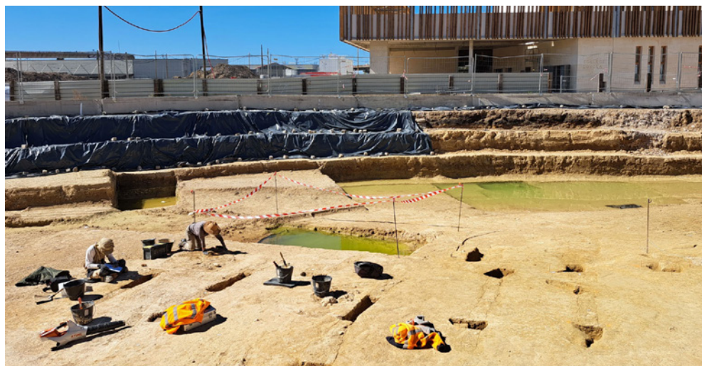
Fouille et enregistrement du deuxième vignobles par les archéologues

Nous vous proposons de découvrir les 3 grandes transformations du quartier à travers 3 zooms historiques !